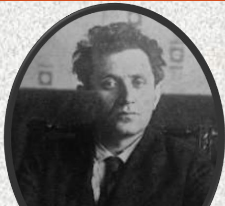
Zinoviev, politico, giustiziato nel 1936