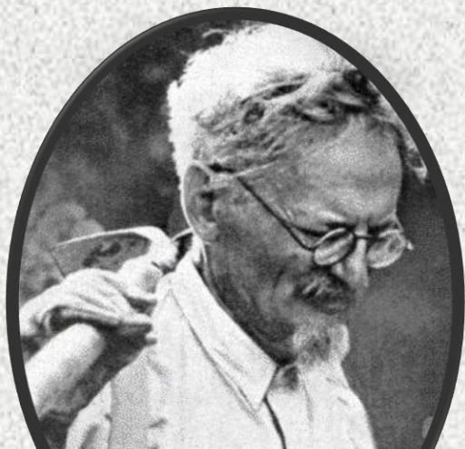
Trockij, fatto uccidere in Messico nel 1940.