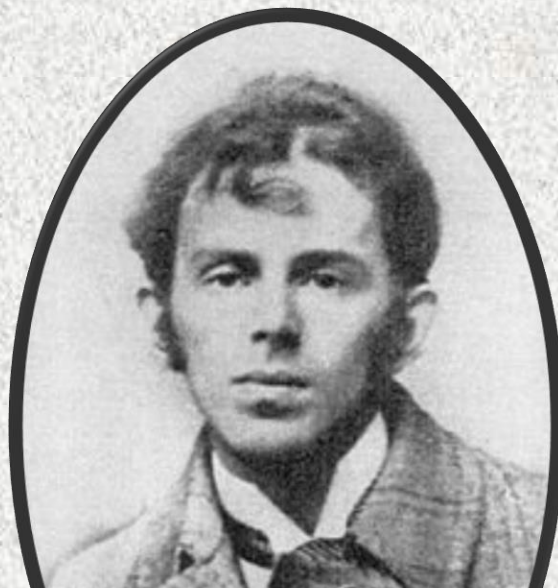
Mandel'shtam, autore di una critica sarcastica nota come Epigramma di Stalin , morì di fame nel 1938 in un gulag.