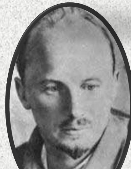
Bucharin, politico, giustiziato nel 1938