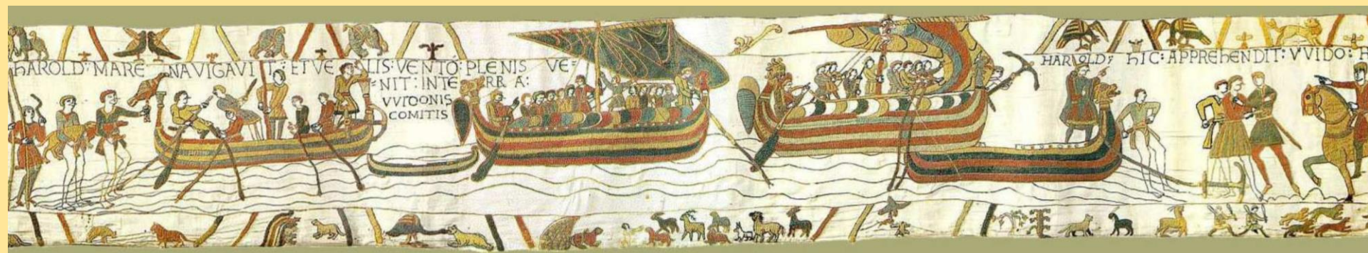
Piccola parte dell'arazzo di Bayeux.